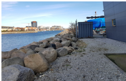
Promenad är inte möjlig längs hela vattnet.