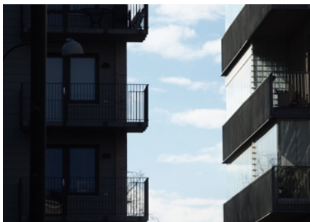
Tät bebyggelse "Ahha, Ni äter pasta idag?"