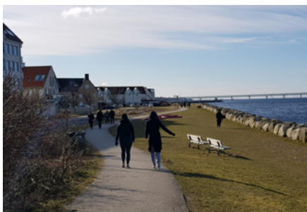
Här finns det yta mellan husen och havet