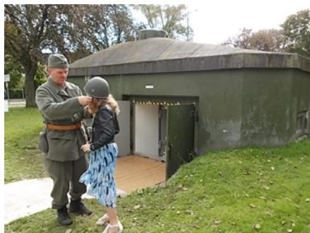
Hjälmprovning vid värnet.

Lördagen 23 september 2017 firades värnets dag på Limhamn. Skyddsvärnet ligger vid