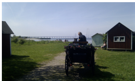
Bröllopsvagnen står redo.

Sedan hoddorna, för något år sedan, renoverats med ny takpapp och färg har dess omgivning blivit än mer inbjudande. Att slå sig ner på bänkarna runt vårt signum, som hoddorna är, har blivit alltmer populärt nu och i framtiden. Utsikten mot havet och bron är betagande.