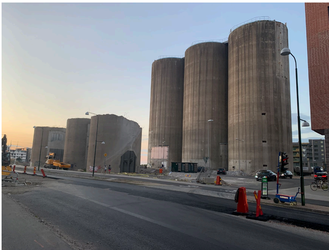
Silorna, år 2020, sedda från Övägen mot nordväst.