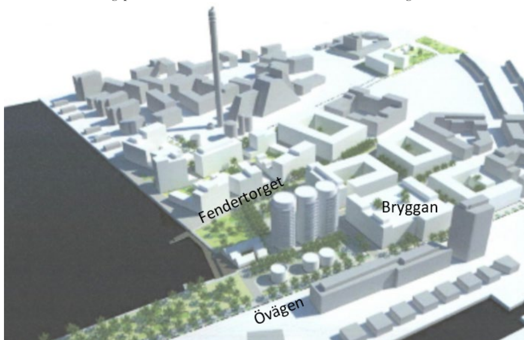
Visionsbild för Limhamns hamnområde, sett från sydväst mot nordost. Visionsbilden tillhör gällande detaljplan. De bevarade silorna syns mitt i bilden.

För Fendern 1 gäller också förbud mot att riva silorna (q). Byggrätten är reglerad enligt befintliga byggnaders volym. Varsamhetsbestämmelse (k) anger att de tre silos som bevaras får tas ner i höjd så att de som lägst är 10 m i totalhöjd. Utformningsbestämmelse (v) anger att det nedre våningsplanet ska vara förberett för lokaler i bottenvåning.