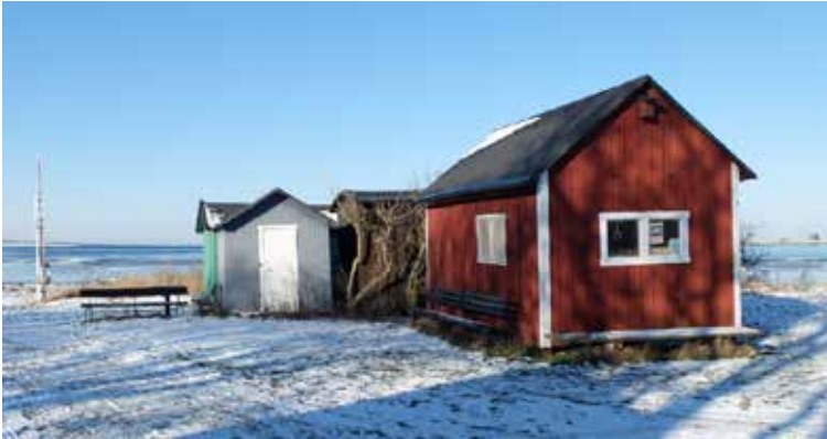
Våra hoddor.

Limhamns Miljöförening är en ideell och politiskt oberoende förening som verkat sedan 1974.