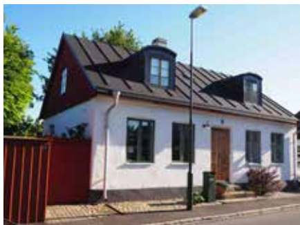
Ankarsmedsgatan 14, år 2020