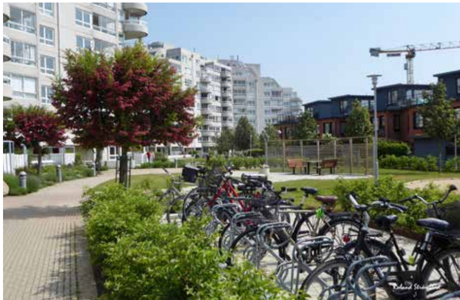
Mästerlotsen Sundholmsgatan - Blommande träd och cykelparkering

Uttrycket kanske har en dålig klang. En del kanske tänker på gamla tiders bakgårdar med stinkande utedass och soptunnor dit inget solljus nådde. Dessbättre har tiderna förändrats även om makthavarna åter börjat ”tänka tätbebyggelse”. Jag vill med mina bilder visa några moderna bakgårdar från 2000-talet på Ön i/på Limhamn. Att bilderna är från sommartider gör ett grönt och kanske lätt överdrivet pittoreskt intryck - men varför inte - så var verkligheten!