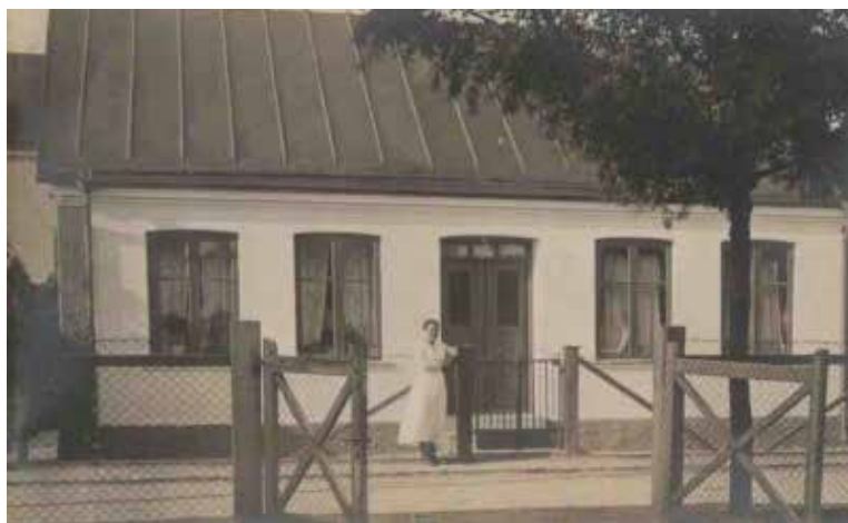
Ankarsmedsgatan 14, år 1898