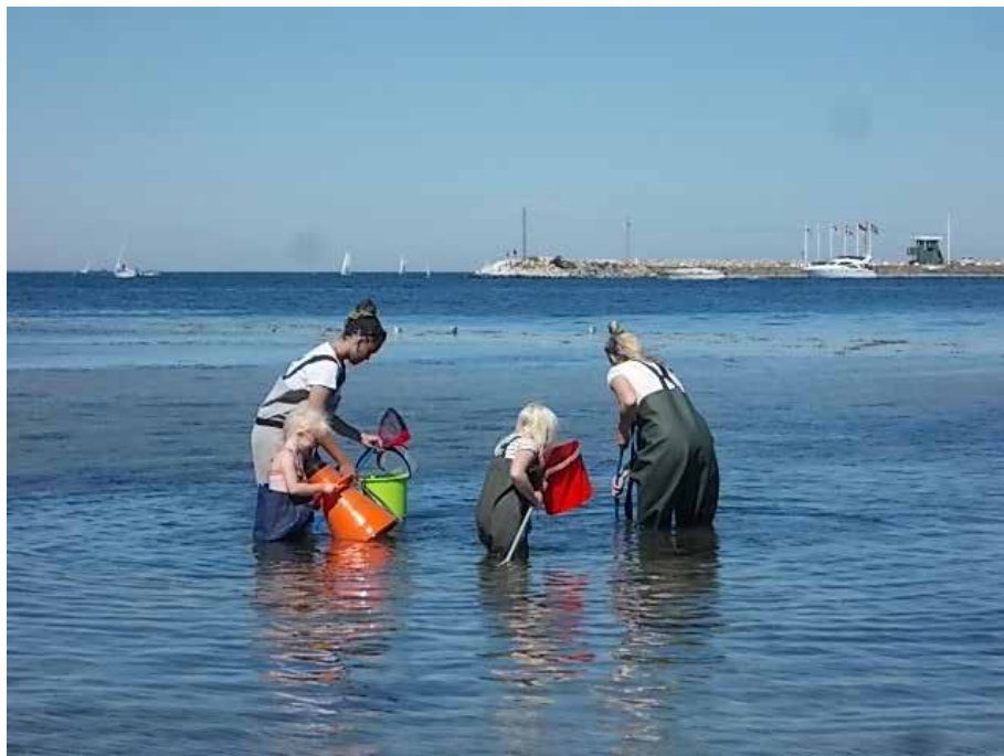
På spaning efter liv i Öresund.

Lördag och söndag den 1-2 augusti besökte vattenverkstaden hoddorna och Kåsehamnen på Limhamn. Vi fick då möjlighet att lära oss mer om djur- och växtlivet i Öresund. Besökarna var välkomna att ta på sig vadarbyxor och stövlar och med håvar och vattenkikare gå ut i Öresund och kika efter vattenlevande djur och växter.