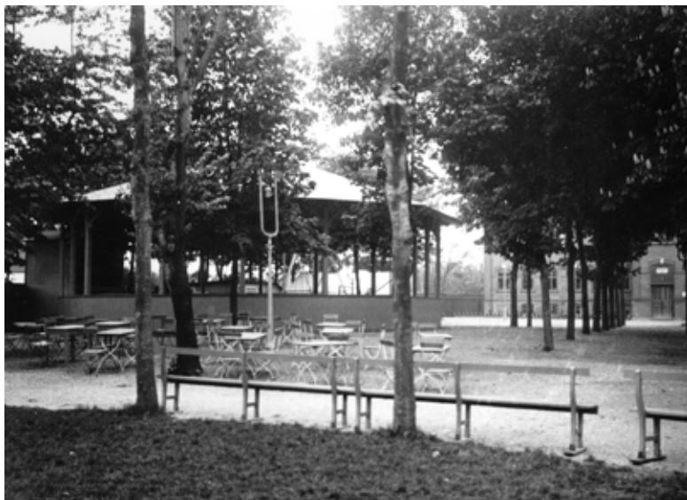
Limhamns folketspark för hundra år sedan

I Malmö stads detaljplan 5637 står att läsa om hur området vid Hyllie Kyrkoväg intill Limhamns förra Folkets Hus (det som vi i Limhamn kallar Zober) ska förändras. Förslaget innebär att befintlig industrimark, som nu bland annat består av bilverkstäder, ska omvandlas och förtätas med bostadsbebyggelse, både flerbostadshus och småhus i 2-4 våningar. Vidare meddelas att någon form av centrumverksamhet ska inrättas i den befintliga industribyggnaden.