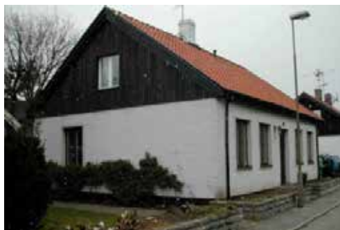
Ankarsmedsgatan 14, år 2006