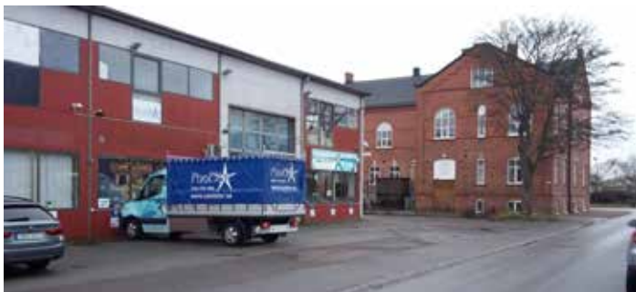
Zober idag.

var inget bra beslut. Den gick nämligen sönder hela tiden och åstadkom mer utgifter än inkomster.