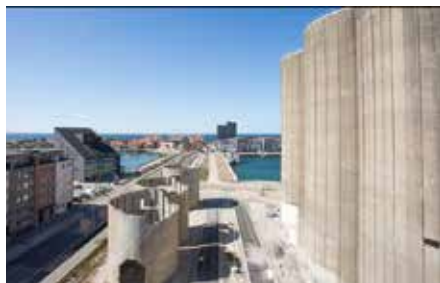
Silorna idag.

När detta skrivs pågår ett detaljplanarbete för att finna ut hur de historiska värdena bäst bevaras. Tills dess får vi leva med resterna av ett klassiskt gammalt landmärke i Limhamn.