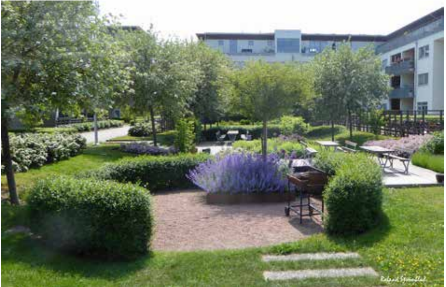
Kronolotsen Sundskajen - Lavendel och flera uterum.