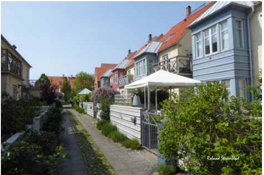
Kompassrosen Båtbyggargatan - Färgglada fasader