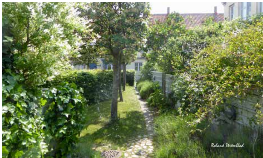
Kompassrosen Båbyggargatan - Grön idyll.