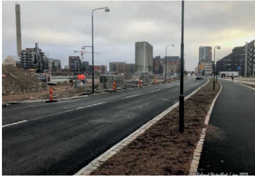
Övägen – bilden tagen från ön mot Limhamn, januari 2023.

tiden enligt uppsatta skyltar till att bli färdig juni 2023.