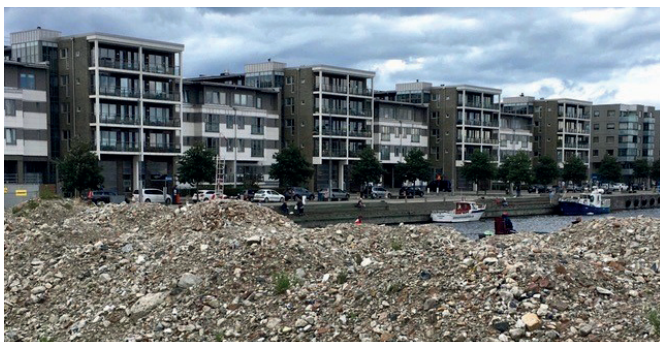
Del av grusvall på Övägen, juli 2020.

Övägen har varit en långdragen historia och ansvariga på Malmö Stad har uppenbart inte varit särskilt intresserade av att lyssna på eller ta hänsyn till kringboendes önskemål. Undertecknad flyttade till Ön intill Övägen för 12 år sedan. Bland annat lockad av det omgivande havet, den vackra kustlinjen och de pittoreska småhamnarna. Konstaterade då också att Malmö Stads framtida planeringar för omgivningarna verkade tilltalande. Jag måste också i sammanhanget framhålla att jag inte på något vis ångrat min flytt hit.