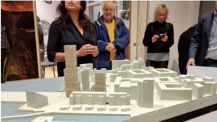
Från söder skall den ursprungliga silon i kombination med de två nya tornen ge uppfattning av de tre torn som finns där idag

offentliga platser och mikroklimat i det nya torget, Fendertorget.