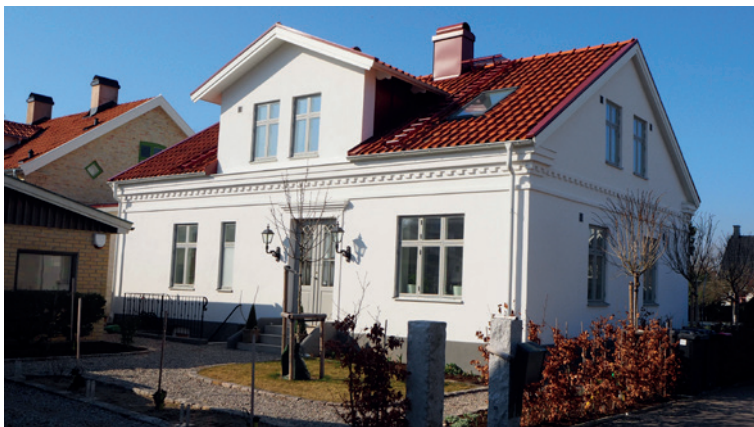
Totalrenovering. Byggt i slutet på 1800-talet. Fin tandlist, tidtypiska fönster

Det är en vacker byggnad med stilfulla listverk, tidsenliga fyrluftsfönster, läcker punschveranda och en elegant entré med en glasinfattad pardörr. Byggt 1895, genomgick huset en hårdhänt ombyggnad under 1960-talet med tegelinfattade perspektivfönster, men har nu återfått sin ursprungliga