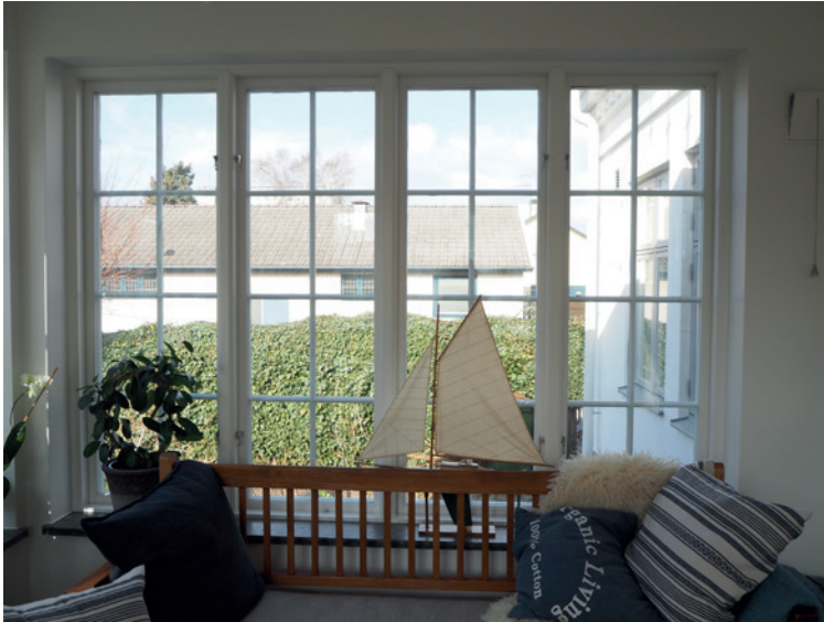
Ett av de vackra nytillverkade fönstren

igång med att riva 1960-talets inredning och för att se vad de kunde hitta av det ursprungliga huset. Under en av takets gipsrosetter hittade de exempelvis namnteckningarna av hantverkarna som medverkat till husbygget 1895. Därefter plockade de ned innerväggar och innertak. De frilade bjälklagen så att endast husets stomme återstod.