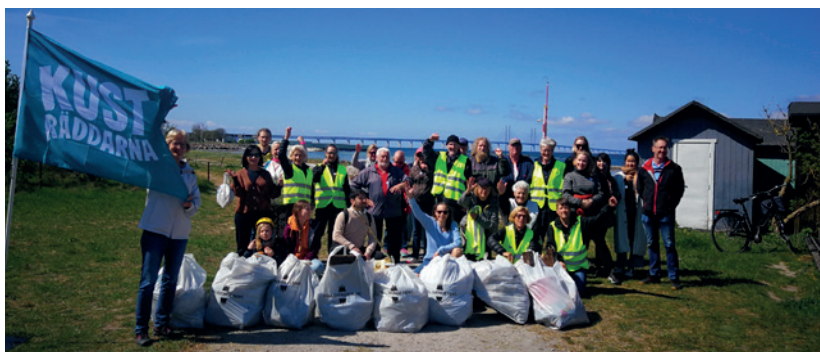
74 kilo skräp och 30 hjältar.

På lördagsförmiddagen den 7 maj hade föreningen strandstädning runt våra fyra hoddor på stranden vid Strandgatan/Götgatan. Vi hade städningen i samarbete med Håll Limhamn Rent och kampanjen Nord-