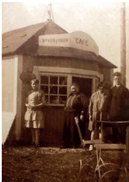
Bild från ca 1920 talet. Samma stolar som finns kvar i kiosken.

Då jag har bott utomlands har mitt minne en liten lucka i Kioskens historia. Mitt goda minne så tror jag att klåfingriga pyromaner har varit där. Därför ser inte kiosken exakt ut som den gjorde förr i tiden. På baksidan finns inte längre den lilla utbyggnaden. Då jag har skrapat och målat allt på kiosken hittade jag på taktassarna gammal ljusgrön färg. Jag tror att kiosken har varit ljusgrön en gång i tiden.