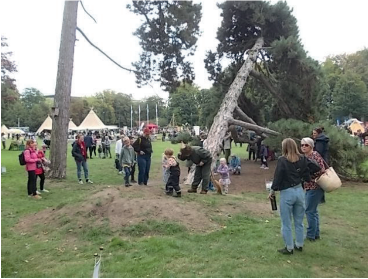
Skogsmulle på äventyr i Slottsparken.

Lördagen och söndagen den 24–25 september var det naturfestival i Slottsparken bredvid stadsbiblioteket för alla naturintresserade som fick fördjupa sig i natur och friluftsliv.