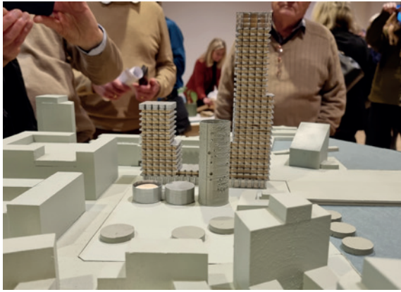
Från norr markeras två av de silorna som tagits bort, med låga cirkelformade byggnader