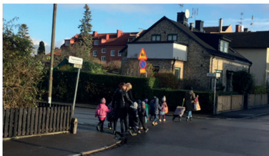
Dagisbarn på promenad.

Korsningen Odengatan/Tegnnergatan, ligger precis vid Willys nedfart och nära biblioteket. Här finns inget övergångsställe och bilarna kör fort.